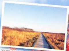
温根内木道(鶴居村)