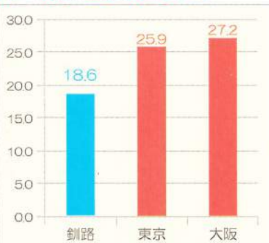
2010~2012年 9~10月の日最高気温の平均

本州では9月でも30度を超える日が多い昨今。残暑知らずの涼しくして長い秋を満喫しませんか？