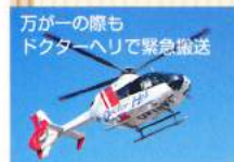
万が一の際も ドクターヘリで緊急搬送