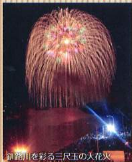
釧路川を彩る三尺玉の大花火