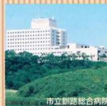
市立釧路総合病院