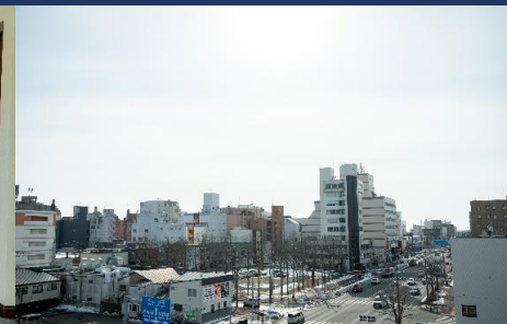
繁華街を一望できる建物からの景色